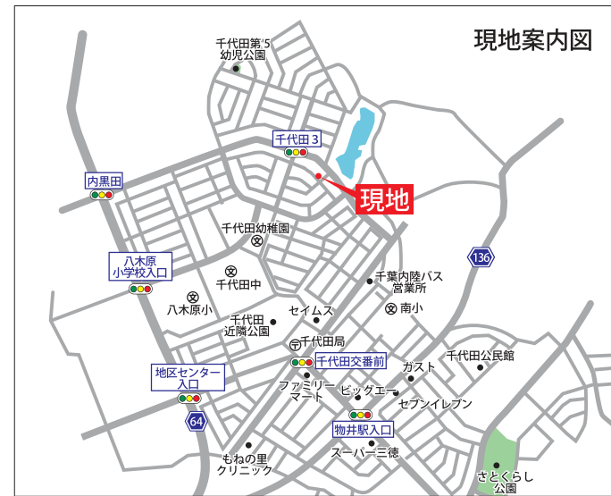
カーナビインプット:四街道市千代田4-45-1付近