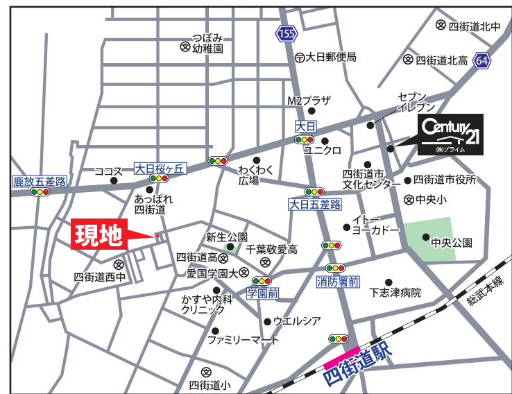
カーナビインプット:四街道市下志津新田2545-348

回転道路が広々として駐車しやすい立地 大型スーパー、保・幼・小・中学校全て徒歩圏内! 子育て世代も安心の住環境です♪